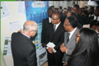
Présentation de la médiathèque et du programme EDUCMAD au Président de la République, au Ministre de l'Éducation Nationale et à leurs équipes