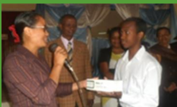
Remise de prix au gagnant du concours scientifique EDUCMAD