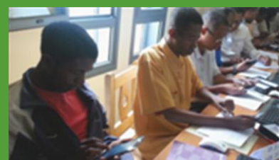
Les enseignants formateurs explorant la médiathèque sur tablette.