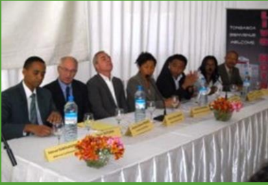
Les intervenants de la conférence débat du 27 septembre