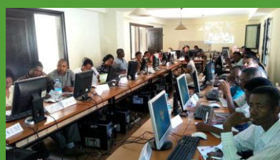
Formation des enseignants formateurs à l'utilisation de la médiathèque électronique.