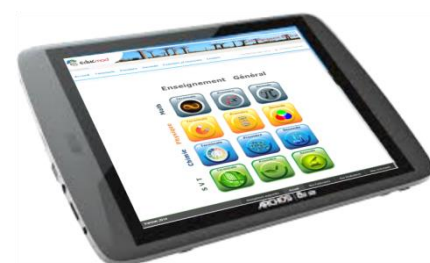
Le nouveau menu enseignement général sur tablette

D'une part la médiathèque a reçu une nouvelle interface de navigation et, d'autre part, ça y est, la médiathèque est entièrement accessible sur tablette et smartphone ! C'est pourquoi la formation des formateurs comprenait une initiation aux tablettes et à l'utilisation de la médiathèque sur celles-ci.