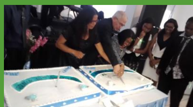
La Responsable du programme EDUCMAD, le Président d'ACCESMAD et la Vice-présidente de Lapa Siansa en train de couper le gâteau d'anniversaire de la médiathèque.