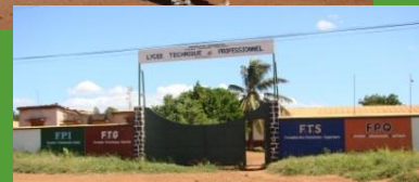
Lycée Technique Antsiranana