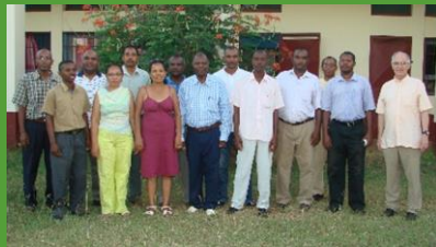
Réunion des proviseurs à Antsiranana (Diégo Suarez)