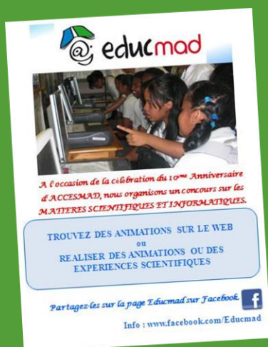
Affiche du concours d'animations scientifiques