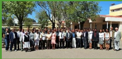
Réunion des proviseurs à Tana