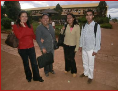
Equipe de suivi à Antsirabe – avril 2013