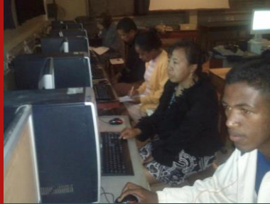
Les ordinateurs d'ORSYS remplacent les PIII donnés par La Poste en 2006