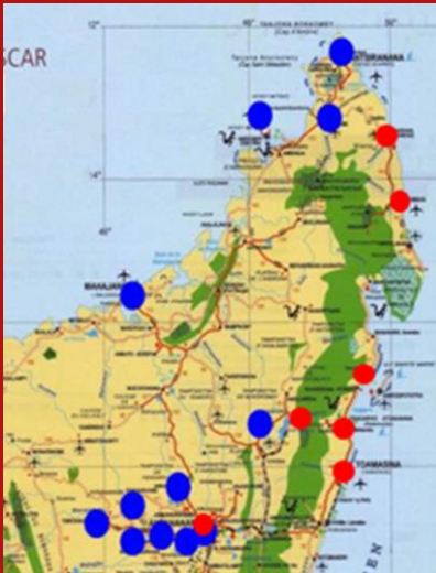
En rouge les futures implantations dans le cadre du projet Telma