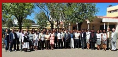
et à Tana !