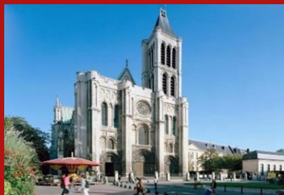
AG d'ACCESMAD et visite de la nécropole de Saint Denis