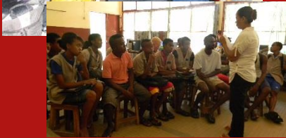
Deux équipes en suivi dans les établissements