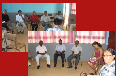
Réunion de la nouvelle association Lapa Siansa à Antsiranana