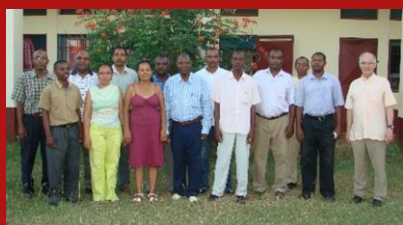
Réunion des proviseurs à Antsiranana (Diégo Suarez)