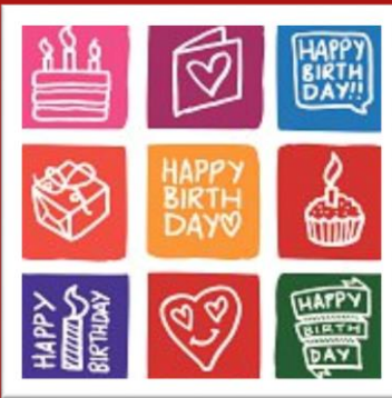
La médiathèque a 10 ans !