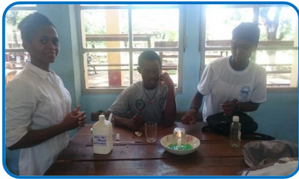
Les élèves ont assurés la démonstration des TP réels