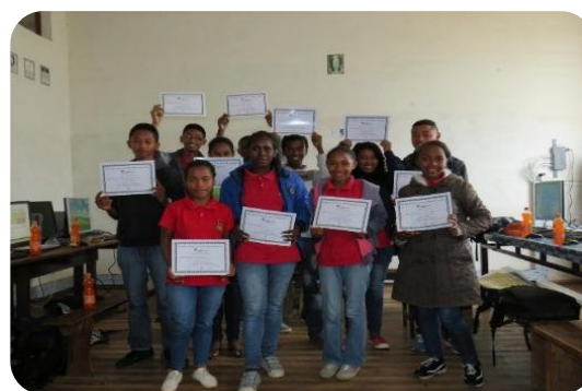
Participation active des élèves pairs au cours des animations scientifiques au lycée SFX Fianarantsoa

Le lycée catholique St Joseph d'Ambalavao ainsi que le lycée FJKM Rozelina, le lycée Adventiste, le collège Saint Joseph et le collège Saint François Xavier de Fianarantsoa étaient sur l'itinéraire de « destination science » les 4, 6, 7 et 8 Mars derniers. Une journée dans chaque établissement pour explorer la « planète science ».