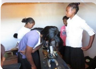
Les travaux pratiques réels axés sur le système D (débrouillardise) ont marqué la journée