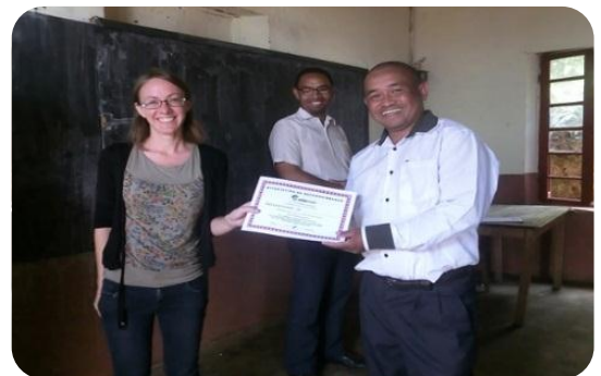
Les responsables du centre EDUCMAD ont délivré une attestation de reconnaissance à tous les participants

Leur témoignage a aussi permis aux élèves de comprendre les évolutions technologiques dans la vie quotidienne et surtout les inciter à choisir les filières scientifiques.