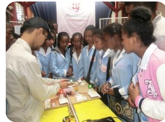
Les travaux pratiques réels réalisés par les enseignants. Travaux pratiques virtuels extraits de la médiathèque