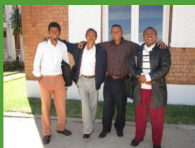
Proviseurs des établissements des régions