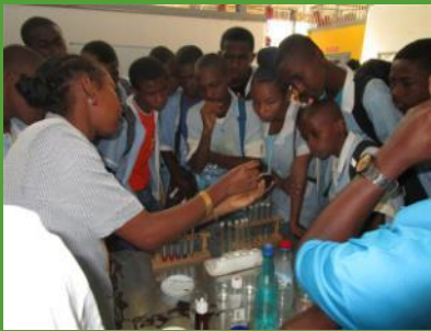
Journées scientifiques à Antsiranana