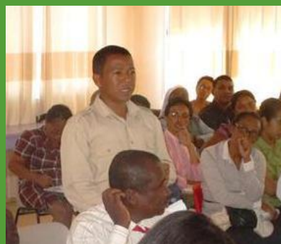
Réunion des proviseurs à l'AFT Andavamamba

« J'ai vu beaucoup d'améliorations dans la médiathèque sous Moodle par rapport à l'ancienne version. Les vidéos et les explications complémentaires des cours aident beaucoup les élèves. En classe, les leçons sont synthétisées. Dans la médiathèque elles