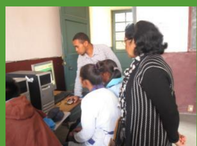
Phase test au lycée RASALAMA

86 000 sites dans 237pays, traduit dansprèsde 120 langues