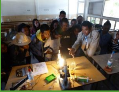
Journée scientifique au LMA