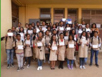
Les animateurs de journées scientifiques ont reçu des attestations de reconnaissance de la part du programme