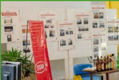
STAR : sponsor officiel des journées scientifiques d'Antsiranana