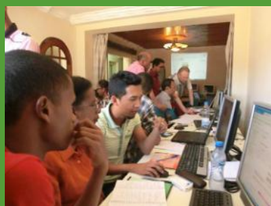
Formation Moodle de l'équipe Mada